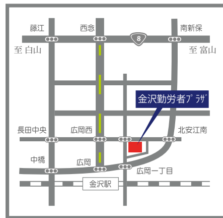
*JR金沢駅西口から徒歩で約10分

セミナー会場では検温実施、アルコール消毒液の設置、換気の徹底、席間隔を十分に取るなど、感染症対策には万全の措置を講じますが、ご来場の皆さまにも次の点をご協力いただきますようお願い申し上げます。