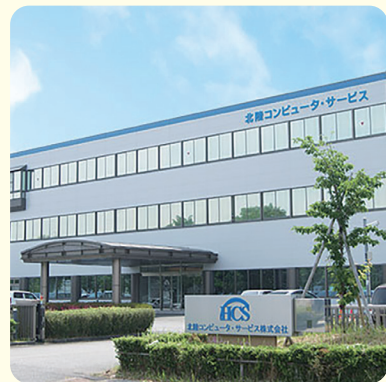
と やま ほん しや ▲ 富山本社

アイシーティー-じょうほう つう しん ぎ じゆつ ICT(情報通信技術)とは、コンピュータやインターネット を使って情報をあつかう技術のことです。ICTを使う と、情報を集めたり、まとめたり、みんなと共有したりし て、仕事を早く正確に進めることができます。北陸コン ピュータ・サービスは、ICTの力を使って、多くの会社の 仕事を便利にするお手伝いをしています。お客様の困 りごとを聞いて、ICTで解決する方法を考えて作り、う まく使えるようにサポートするのが私たちの仕事です。