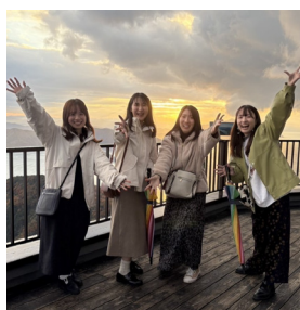
↑福井旅行でのベストショット。

同じ部署の先輩と後輩で、福井旅行に行きました。一棟貸しを予約し、市場で食料を調達して料理をしました。お酒を飲みながら深夜までプライベートな話で盛り上がり、楽しい時間を過ごせました。来年も行こうと約束したので、必ず叶えたいです！