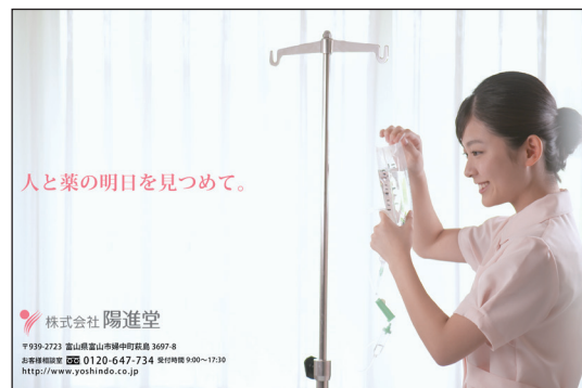
人と薬の明日を見つめて。

株式会社陽進堂 〒939-2723 富山県富山市中町南 5007-8 営業時間 電話 0120-647-734 受付時間 9:00~17:30 http://www.yoshindo.co.jp