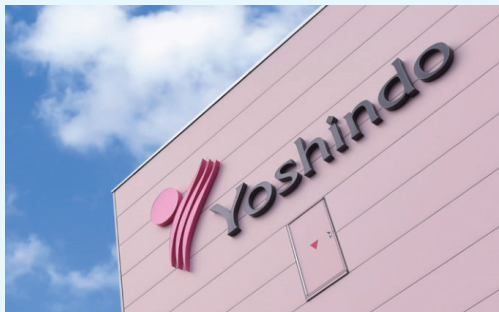
株式会社陽進堂 本社外観