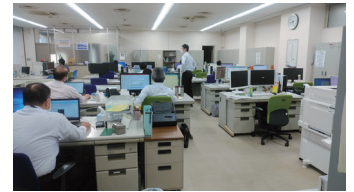
HCS 高岡支社オフィス

いろいろな店の料理をテイクアウトで楽しんでみたいです。敷居が高くなかなか行けないような店でもテイクアウトを始めているのでこの機会に試してみたいです。フランス料理が好きなので、テイクアウトができるようになったら、家でワインとともにゆっくり味わいたいです。