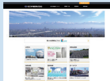
同社 HP のトップ画面(一部)