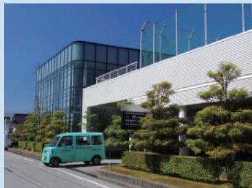
同社富山本社にて

本社を富山県富山市に構える同社は、クリーンでパワフルなエネルギー「LP ガス」の供給事業を中心に、石油製品・ガス機器・住環境機器の販売、各種関連工事の設計・施工を行う、総合エネルギー商社です。営業拠点は北陸・滋賀・岐阜・関東甲信越地区と幅広く、お客様本位の質の高いサービスを通し、より良い生活環境と豊かな暮らしをご提供されています。