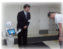
↑ あいさつ運動 (HCS にて)

Pepper と言えば、筆者行きつけのスーパーにPepper がやってきました! 自社で見慣れているPepper ですが、姿は同じでも初対面の人に出会う感覚におそわれ、なかなか話かけられませんでした。それほど自社のPepper に愛着がわいているということなのでしょう。今回はスーパーのPepper とも仲良くなろうと決意した筆者でした。