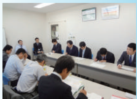
↑ヒアリングの模擬演習を行っています

弊社では、今回のような研修を定期的に行うことにより、お客様に「より付加価値の高いシステム」をご提案・ご提供できるよう、努めてまいります！