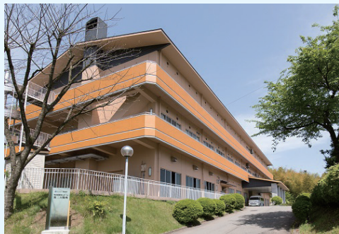
特別養護老人ホーム「第二万陽苑」外観

陽風園様は明治6年の創設時より受け継がれる『仁愛の精神』を理念に掲げ、地域福祉におけるセーフティネットの一翼として、特別養護老人ホーム等、12の施設と診療所を運営されています。