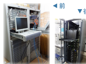
2台のラックに13台のサーバは1台にスッキリ!

それまでは事務員が帰った後に行っていた処理が、昼休みの時間内に終わるので、大きな改善点です。