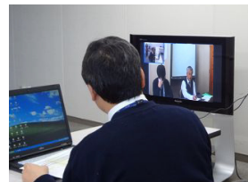
利用の様子(開発ミーティング)

2004年9月にテレビ会議システム導入した当社では、全国6拠点での接続が可能です。距離の離れた各拠点を横断した共同開発プロジェクトが存在する当社では、移動費の削減を目的に小さな会議はもちろん、本部の全体会議などに利用されるほか、年賀式や創立記念日には社長の式辞を配信しています。テレビ会議システムは、連日フル稼働するほど重要なインフラになっています。